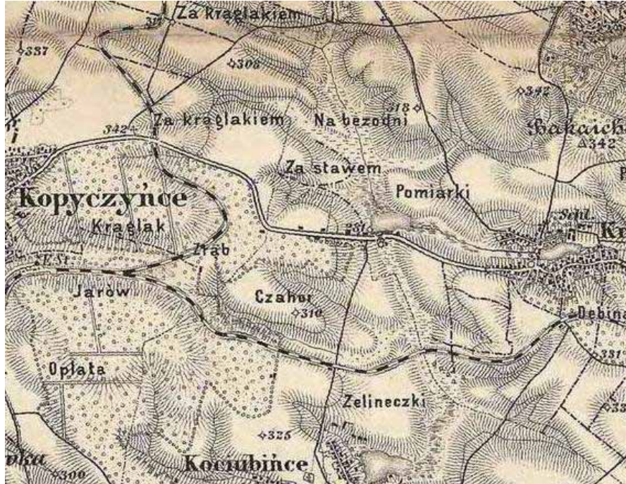
Рис. 2. Топографічні назви на угорській карті 1869–1887 рр.

«ZuKrogules» (переклад – «До Крогулець»)[19] 1 . Вважаємо, що на хуторі проживали вихідці з вказаного села, які працювали у млині. Спорудження водяного млина було пов'язане з господарськими потребами панського фільварку в с. Крогулець.