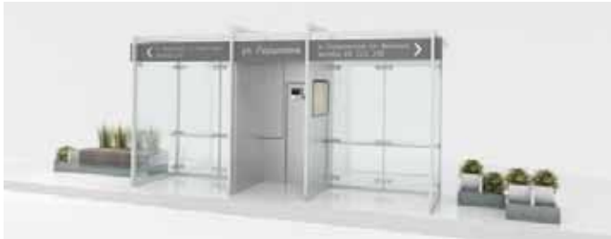
Рис. 1.1. Зупинка громадського транспорту