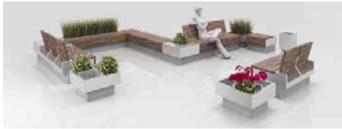
Рис. 1.2. Комплект сидінь з декоративними клумбами

композиції залежно від конфігурації місцевості, за необхідності – з додатковими опціями. Цим зумовлені універсальність комплекту, його можливість застосування і на зупинці для очікування транспорту у вигляді вузької двомісної лавки (рис. 1.1.), і в парку шляхом створення великої кругової композиції з декоративними клумбами (рис. 1.2.).