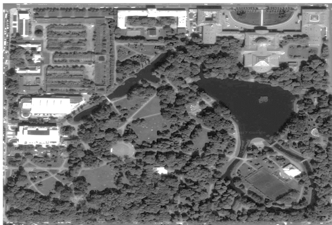
Рис. 2. Супутниковий знімок Таврійського парку в Санкт-Петербурзі.

живописний пейзаж відкривався з вікон палацу, а з іншого – щоб з деяких віддалених куточків парку було видно палац у всій красі або інші будівлі, що живописно відбиваються на поверхні водойми, створюючи локальні композиційні вузли. Самі водойми обов'язково присутні у парку. Їх площа залежала від площі парку та доступності водного ресурсу. В Санкт-Петербурзі вона