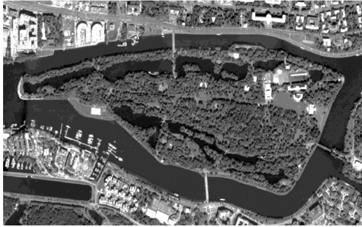
Рис. 3. Супутниковий знімок парку на Єлагіному острові.

У Санкт-Петербурзі невеличкі пагорби мають штучну природу. В Богоявленську пологі схили Вітовської балки – справжня знахідка для ландшафтного майстра. Перепад висот у Богоявленському парку становить близько 20 метрів. Найвища точка – північна частина парку. Найнижча – водойми. Висота південного пагорбу – близько 10 метрів, але схили його крутіші за північні. Завдяки пагорбам зі схилами, що спускаються з боків до центральної водойми автор досягає ефекту, коли перспектива парку поступово переходить у живописний пейзаж лиману, що відкривається тільки в певних місцях парку (так званий прийом “ах-ах”).