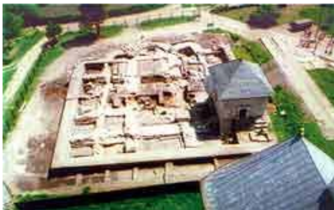
Рис. 4. Фундаменти Успенського собору XII ст. в Крилосі під час розкопок в 1999 р.