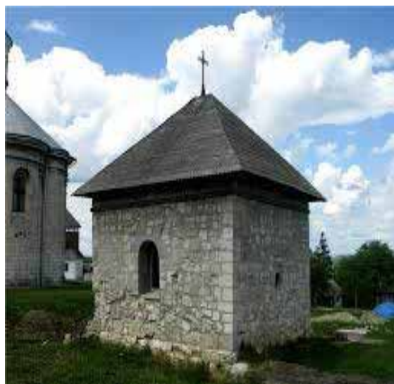
Рис. 5. Каплиця св. Василя XV ст.