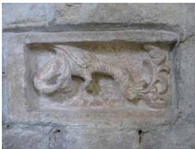
Рис. 7. Елемент кам'яного різьблення XII ст. Дракон.