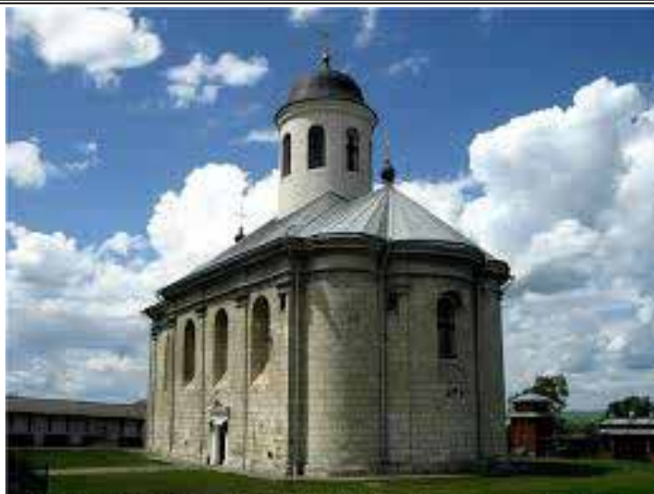
Рис. 6. Церква Успіння Пресвятої Богородиці XVI ст.