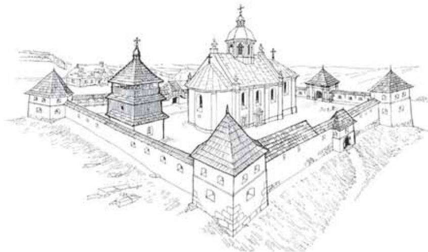
Рис. 3. Загальний вигляд Крилоського монастиря в першій половині XVIII ст. (реконструкція В. Петрика)