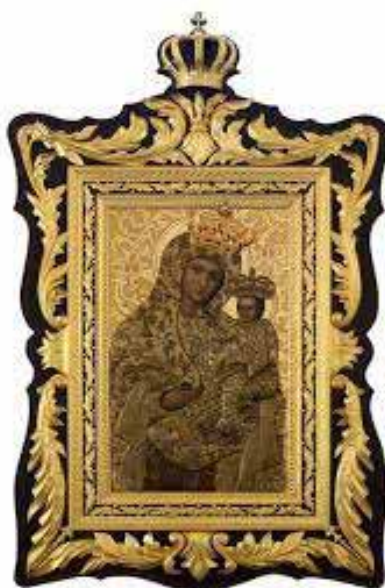
Рис. 8. Чудотворна ікона Матері Божої з Крилоса.