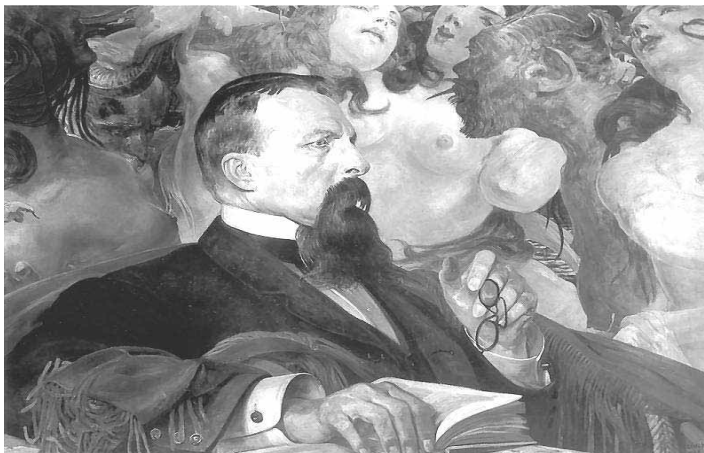
3. Мальчевський Я. “Е. Раджинський”. Полотно, олія; 75x100 см. Національний музей, Познань. 1903.