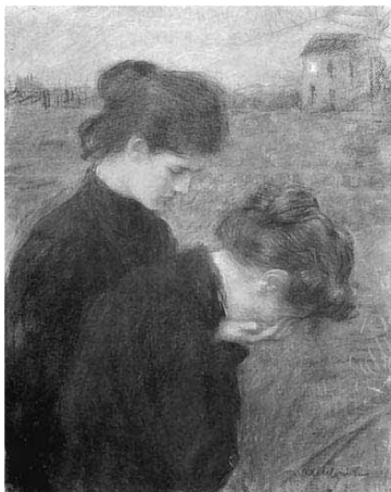
2. Аксентович Т. “Під тягарем лиха”. Пастель, папір; 81,8 x 65,5 см. Львівська галерея мистецтв, Львів. 1917.