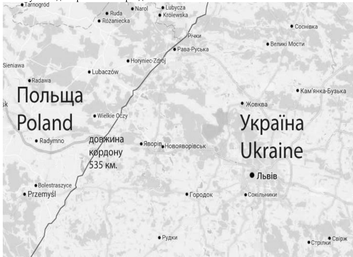
Рис. 2. Кордон між Польщею та Україною

У 1944 р. радянська сторона провела переговори на східному кордоні Польщі і у ході обговорення, з української сторони лінія проходила на схід від Перемишля, на захід зі сторони Рави Руською до річки Західний Буг. Така лінія мала назву «лінія Керзона». Домовленості були у кількох варіантах: лінія проходила на 80 км. на захід від Львова, залишивши Перемишль польській стороні; лінія, яка залишала Львів та нафтові промисловості, разом з Бориславом та Дрогобичем Польщі[7].