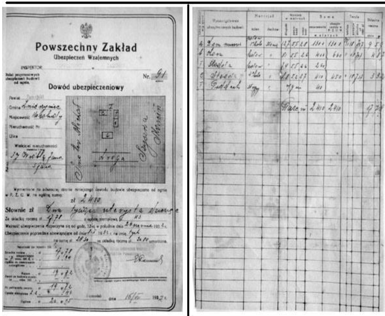
Рис. 4. Польський документ оцінки майна та страхівка (30-х рр. XX ст.)

На рисунку 4 вказана оцінка майна, яким володіла родина, його вартість та страхівка. Варто зазначити, що при виселені у людей конфіскували майно, як поляки, так і росіяни.