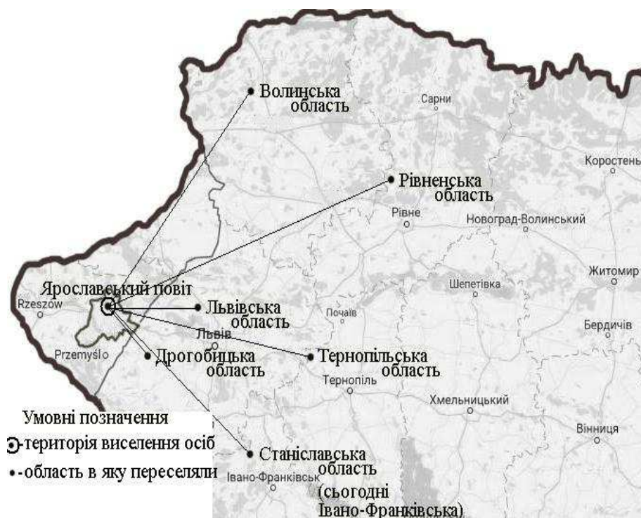
Рис. 3. Картохема напрямку, в якому виселяли людей з території Польщі до України (1944-1946 рр.)

Складена картохема показує, що людей заселяли переважно у західні регіони України.