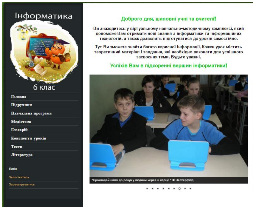
Рис. 2. Головне вікно ЕНМК з інформатики для 6 класу