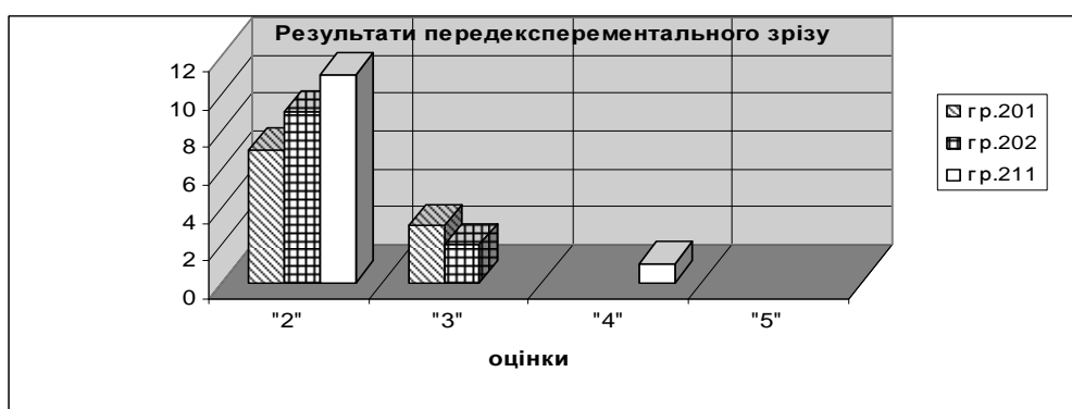
Рис. 1. Результати передекспериментального зрізу трьох експериментальних груп.

Аналіз передекспериментального зрізу кожної групи дозволяє констатувати, що результати виконання його тестів студентами контрольних та експериментальних груп дещо відрізняються. Зауважимо, що у межах статті ми не розглядаємо порядок оцінювання передекспериментального та післяекспериментального зрізів. Так, з графіку № 1 можна побачити, що найбільшу кількість «двійок» за тест отримали студенти експериментальних груп № 1 (ЕГ-1) і № 3 (ЕГ-3), натомість експериментальної групи № 2 (ЕГ-2) показали дещо кращі результати, отримавши меншу кількість «двійок» (рис.1).