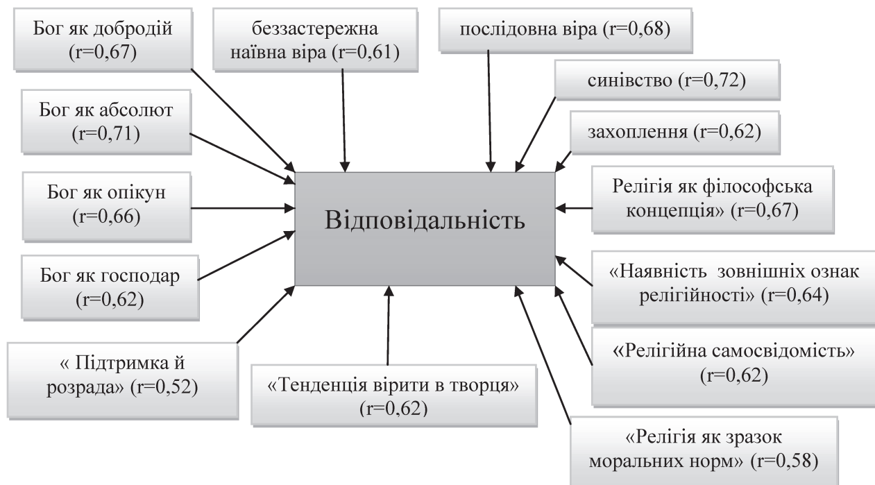
Рис. 1. Позитивні кореляції шкали «Відповідальність» опитувальника ОЗО зі шкалами опитувальників СДОБ, Методики визначення релігійних вірувань Д. Хутсебаута, Тесту для визначення структури індивідуальної релігійності Ю. Щербатих

Релігійність юнаків і дівчат студентського віку має гендерні відмінності. Так, дівчата проявляють більшу активність, їх релігійність емоційніша, вони більш конформні, менше відчувають сумніви, їхні релігійні уявлення і переконання є консервативнішими, ніж в юнаків. Дівчата більше захоплюються Богом, зачаровуються його величчю. Вони частіше схильні вважати Богородицю порадицею, частіше зверта-