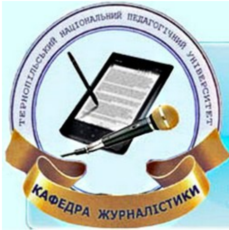
Рис.1 Логотип кафедри журналістики виконано студентами спеціальності

Специфіка підготовки майбутніх журналістів у вищих навчальних закладах невіддільна від вимог часу. Навчальні програми, за якими студенти освоюють професію, вимагають постійного оновлення та модернізації. Колектив кафедри намагається відповідати сучасним запитам у царині вищої школи та журналістики.