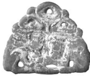
Рис. 8. Позолочена півовальна бронзова пластина з зображенням хреста та двоголового орла розміром 30 x 40 мм 2 . Приватна колекція