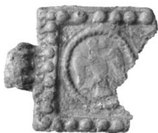
Рис. 1. Свинцева підвіска римського періоду розміром 30х30 мм 2 з зображенням орла

Отже, культурне спілкування населення Галицько-Волинської Русі зі сусідніми народами й країнами сприяло утвердженню в державній символіці образу двоголового орла. Разом з тим, він став невід'ємним елементом різних галузей давньоруського декоративно-прикладного мистецтва, оскільки краса цього гордого птаха заворожувала мистецьку уяву місцевих художників, а для звичайних громадян орел був оберегом і захисником у всіх випадках життя.