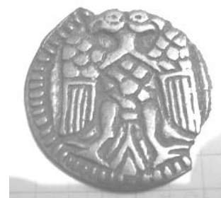
Рис. 6. Срібна підвіска з зображенням двоголового орла діаметром 30 мм. Приватна колекція