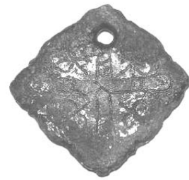
Рис. 9. Мідна підвіска з хрестом та залишками позолоти розміром 28 x 28 мм 2 . Приватна колекція