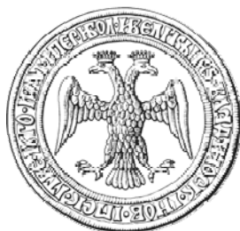
Рис. 4. Двоголовий орел на печатці Івана III (1497 р.). Російський державний архів давніх актів (Москва, Росія).