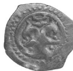
Рис. 3. Аверс золотоординської монети 1270–1290 рр. Діаметр монети 20 мм