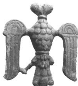
Рис. 5. Бронзовий барельєф двоголового орла розміром 58 x 50 x 8 см 3 . Приватна колекція