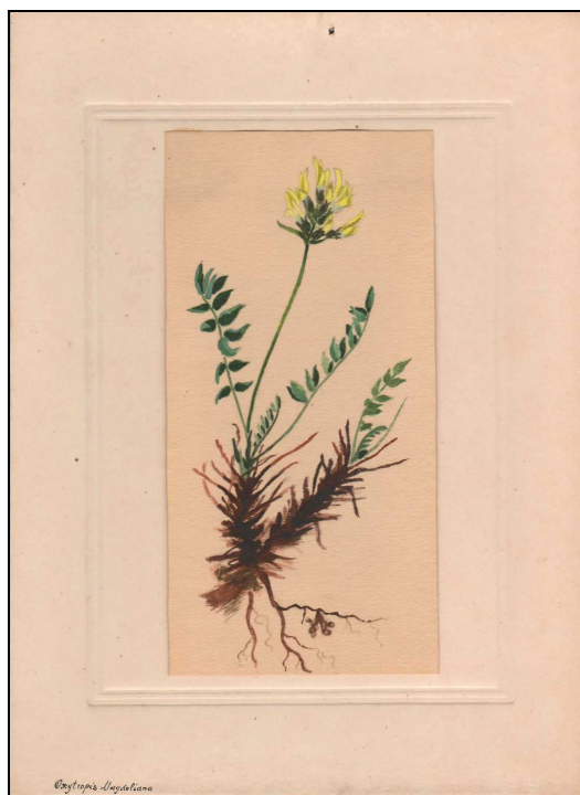
Oxytropis maydeliana Trautv.