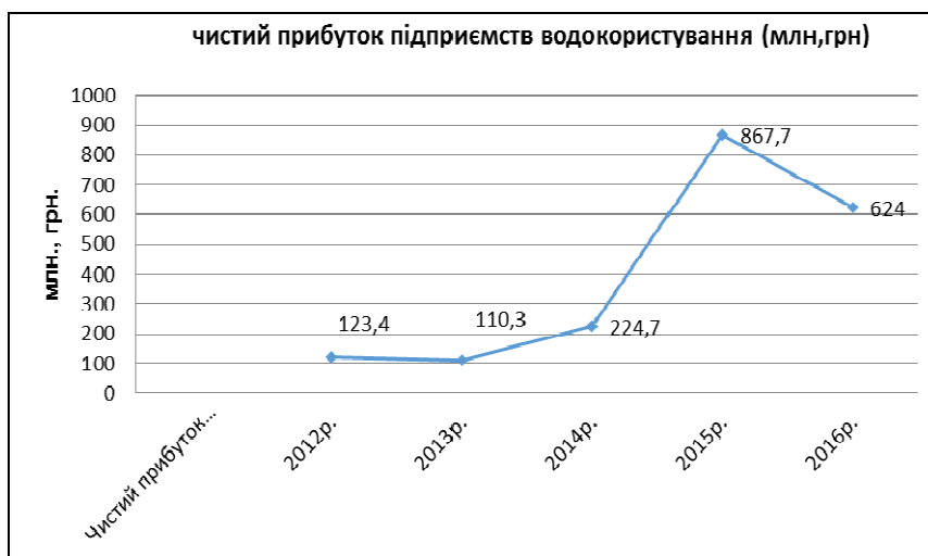
Рис. 1. Чистий прибуток підприємств водокористування [3].

Подальше вдосконалення теорії ренти пов'язане з необхідністю врахування в усіх розрахунках, що стосуються економічної оцінки водних ресурсів, абсолютної ренти, оскільки перехід до ринку спричинив розвиток різноманітних форм власності, і, насамперед, приватної, яка в свою чергу є джерелом виникнення абсолютної ренти.