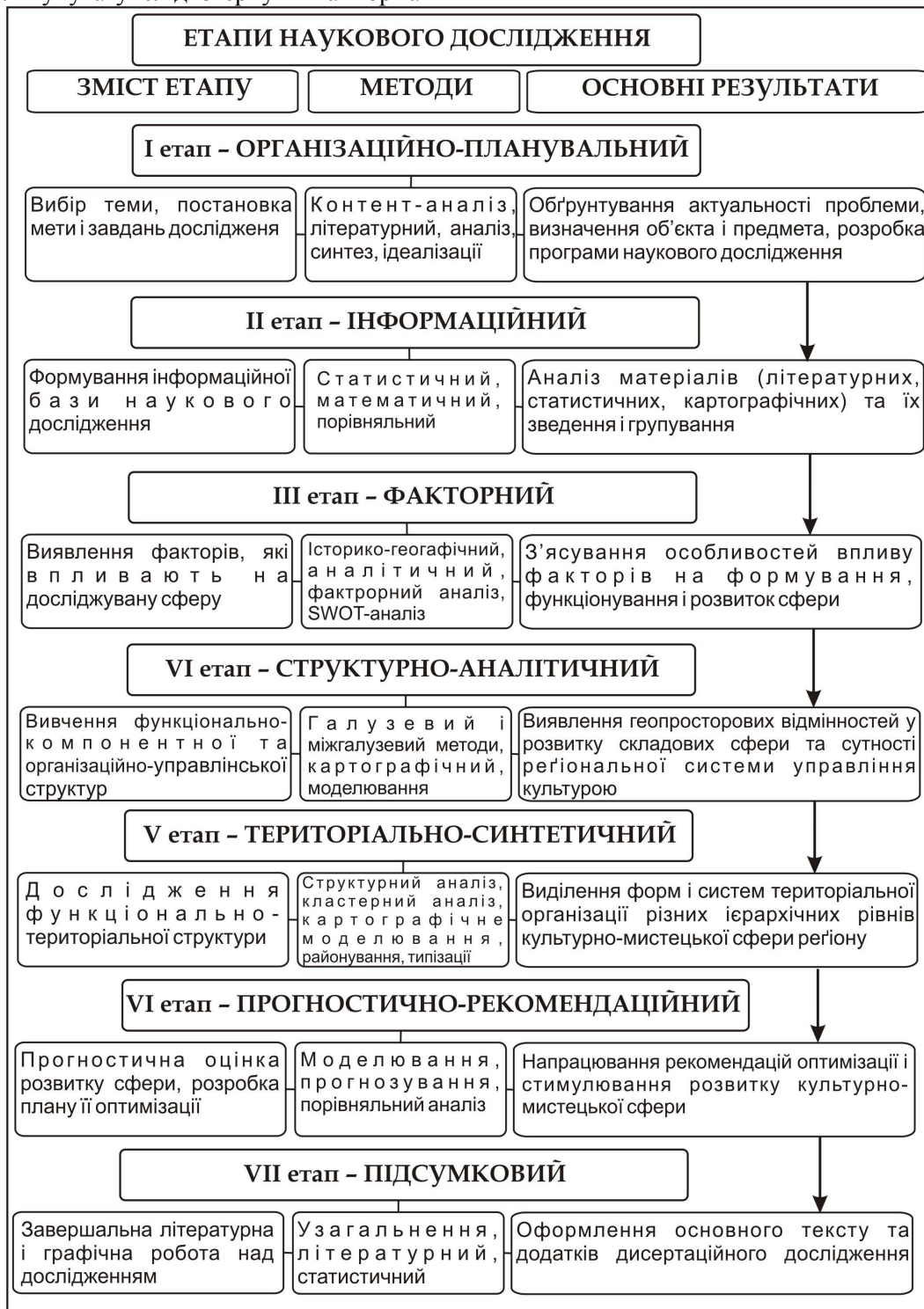
Рис.2. Етапи суспільно-географічного дослідження культурно-мистецької сфери регіону

тивно-правові акти, які визначають юридичні основи та регулюють функціонування суб'єктів культурно-мистецької сфери. Зокрема у процесі її виокремлення із господарського комплексу країни потрібно ґрунтовно проаналізувати класифікацію видів економічної діяльності, товарів і послуг, галузеві закони, накази профільних міністерств та відомств. Окрім того особливу увагу слід звернути на нормативи забезпечення населення послугами соціально-культурного сервісу та ін.