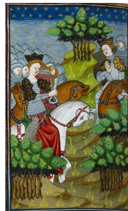
Рис. 2. Митридат VI Евпатор і Гіпсікратія Рис. 3. Митридат VI Евпатор і Гіпсікратія (BL Royal 20 C V, f. 119; 1400–1424 pp.) (BL Royal 16 G V, f. 91v; 1440 p.)

А. Мейор визнає, що неможливо встановити точні характеристики, ким була Гіпсікратія – дружиною чи воїном [10, p. 307]. Розглянуті джерела дають підстави стверджувати, що Гіпсікратія була і дружиною (Валерій Максим називав її «regina» (цариця) (Val. Max. IV, 4.6.ext.2), отже, дружина), і вірною військовою супутницею царя під час воєн з Римом. Це висвітлено і в античних джерелах: «tonsis enim capillis equo se et armis adsuefecit» (обрізала до того ж волосся і всіма силами сама зброю використовувала) (Val. Max. IV, 4.6.ext.2), і зображено на мініатюрах [6, f. 119; 7, f. 91v] (озброєна Гіпсікратія обрізає собі волосся верхи на коні поруч із Митридатом) (Рис. 2; рис. 3).