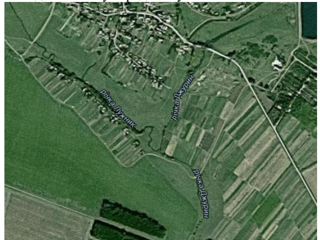
Рис.1. Злиття Лужника з іншими потоками біля села Джурина Слобідка [8]

ких Карпат і річки південно-західної частини Подільської височини. У басейні налічується 14886 малих річок сумарною довжиною 32,3 тис. км. Середня густота річкової мережі – 0,65 км/км 2 . Річкова мережа басейну навдивовижу проста. Основна його артерія – Дністер – яскраво вирізняється серед своїх численних приток, що переважно мають незначну довжину: найбільші з них сягають 200–250 км, а приблизно 550 річок мають довжину близько 10 км. Ріки стрімкі, багатоводні. Модуль стоку, хоч і дещо нижчий, ніж у річок Дунайського басейну, проте сягає значних величин: 10-15 л/с з 1 км 2 – у приток високогір'я, на середньо-гірських ділянках – у середньому 5 л/с з 1 км 2 .