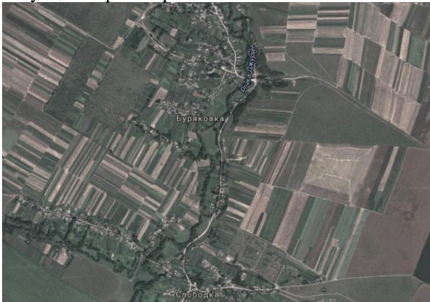
Рис.4. Сильно меліоровані землі в околицях с.Слобідка і с.Буряківка [8]

Слобідка, Джурин, Полівці тощо. Ставкове господарство, яке діє у с. Джуринська Слобідка істотно не впливає на загальну ecologicalну ситуацію верхів'я річки.