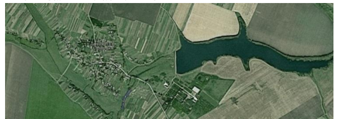
Рис.3. Ставок в районі Джури́нської Слобідки [8]

Перший відрізок за своєю структурою землекористування вирізняється нечіткістю річкової долини; відсутність глибокого врізу річища в прилеглі території сприяли повномасштабному осушенню верхів'я річки і лівобережної частини її басейну. Права притока р.Джури́н на витках поблизу селища Криволуки меліорована (колись там був ставок, на даний момент залишилась лише