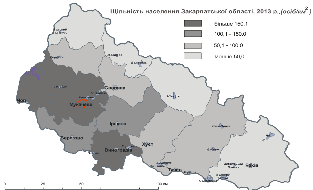
Рис. 2. Щільність населення Закарпатської області у 2013 році, осіб на км 2

Важливою демографічною умовою реалізації безперервного освітнього процесу є стан статеві-вікової структури населення. У Закарпатській області спостерігаємо зменшення населення, яке складає основний контингент загальноосвітніх закладів. Так, порівняно з 2000 р., у 2014 р. чисельність осіб віку від 0 до 14 рр. скоротилася на 7,5%, від 0 до 15 рр. скоротилася на 9,1%, від 0 до 17 рр. скоротилася на 14,6%. Проте, для старших вікових груп населення, зокрема від 16 до 59 та від 15 до 64 рр. спостерігалось збільшення чисельності. Їх показники відповідно зростають на 1,1 та 1,2%. Дана група населення є основою для формування і розвитку професійної освіти, постійного процесу підвищення кваліфікації трудових ресурсів Закарпатської області.