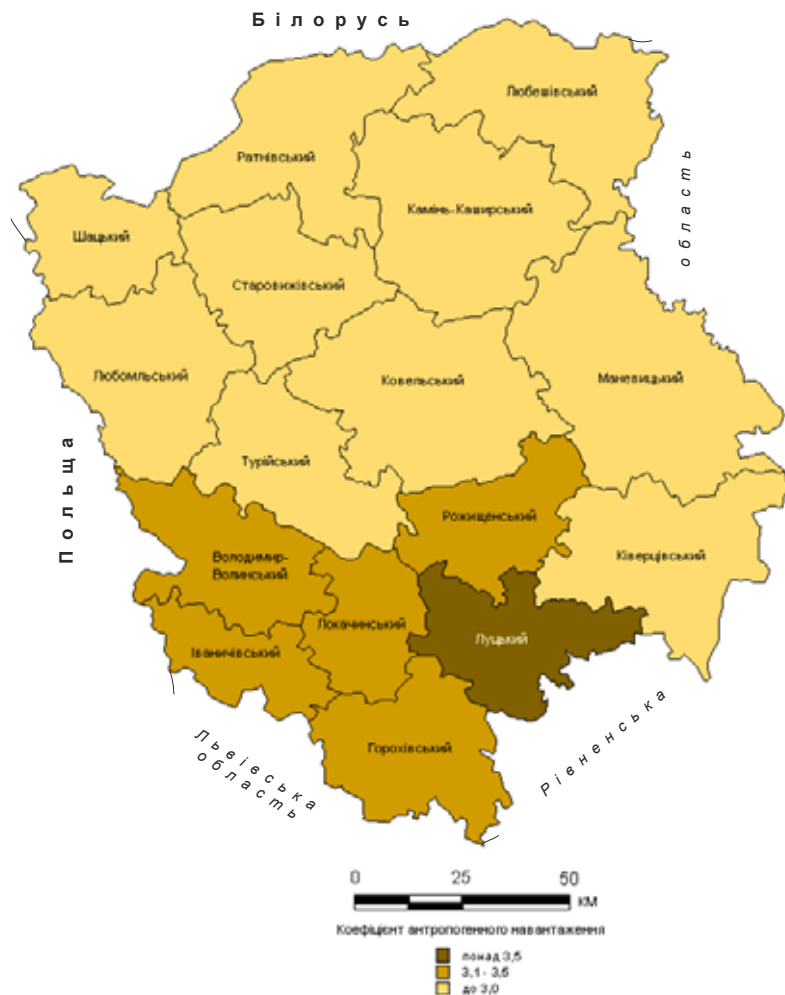
Рис. 3. Антропогенне навантаження на земельні ресурси Волинської області в розрізі адміністративних районів

линська область характеризується середньо-збалансованою територіальною структурою. Проте в розрізі адміністративних районів простежується чітка диференціація зазначених показників за природними зонами: поліські райони відзначаються середньозбалансованою та навіть екологічно збалансованою територіальною структурою, у той час як південні лісостепові райони мають нестійку вразливу або екологічно незбалансовану територіальну структуру.