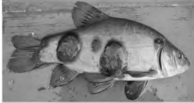
Рис. 2. Новоутворення на шкірі у лина

Пухлина у лина мала щільну консистенцію, на розрізі сіробрудного кольору з матовим відтінком, у вогнищі ураження спостерігали наявність слизу. При її гістологічному дослідженні у структурі пухлини виявляли поліморфно-округлі та веретеноподібні пухлинні клітини. В пухлині спостерігали багаточисельні фігури патологічних мітозів та округлі слизовмісні клітини сполучнотканинної природи. Морфологічно пухлина була верифікована як поліморфноклітинна саркома з міксоматозом строми.