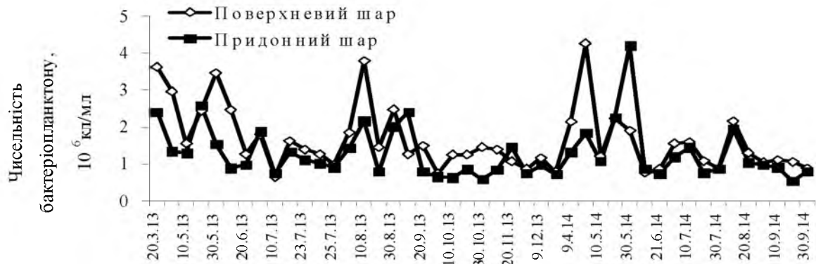
Рис. 1. Динаміка чисельності бактеріопланктону в поверхневих і придонних водах моря біля острова Зміїний в 2013–2014 рр.

До евтрофних вод, які за ступенем чистоти є слабо забруднені відносилося лише 11% проб з поверхневого і 4% проб з придонного шару. Середня чисельність бактеріопланктону поверхневих вод у 2013 і 2014 рр. складала 1,71 \pm 0,87 \cdot 10^6 і 1,54 \pm 0,86 \cdot 10^6 кл/мл, відповідно, та відносилися до мезотрофних вод, які за ступенем якості належать до категорії “досить чисті”. В придонному шарі чисельність бактеріопланктону була декілька меншою ніж на поверхні і складала 1,26 \pm 0,60 \cdot 10^6 у 2013 р. і 1,34 \pm 0,87 \cdot 10^6 кл/мл у 2014 р., що відповідало мезотрофним водам (по якості – к категорії “чисті”). За чисельністю бактеріопланктону в загалом для всієї водної товщі останні два роки були практично однаковими ( 1,48 \pm 0,78 \cdot 10^6 кл/мл у 2013 та 1,44 \pm 0,86 \cdot 10^6 кл/мл у 2014 рр.) і характеризувалися категорією чисті та мезотрофним статусом. Аналіз сезонної динаміки бактеріопланктону показав, що упродовж вегетаційного періоду 2013 р. середньомісячні значення чисельності бактерій змінювалися від найвищих у квітні ( 2,97 \cdot 10^6 кл/мл) та серпні ( 2,58 \cdot 10^6 кл/мл) до найменших ( 0,98 \cdot 10^6 кл/мл) у грудні. Відповідно цьому якість вод змінювалася від категорії слабо забруднені до категорії “чисті прибережні воді” (рис. 2). В обидва роки спостерігалися типові сезонні зміни чисельності бактеріопланктону [2], які характеризувалися максимумами навесні та в серпні з поступовим зменшенням восени.