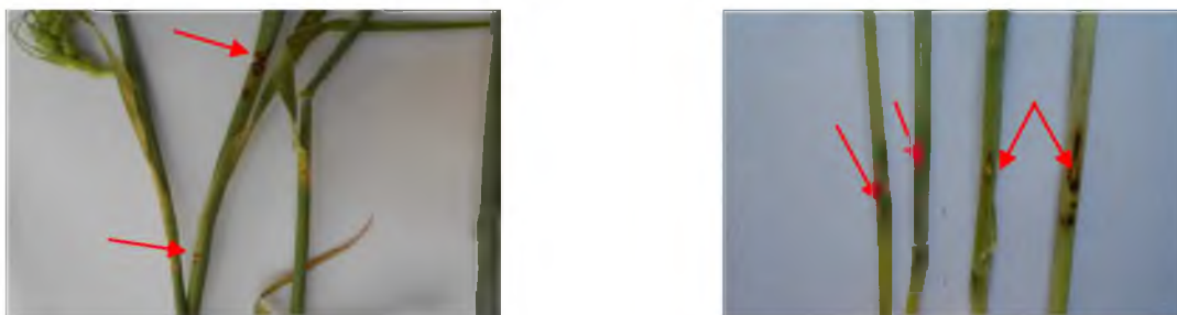
Рис. 3. Результати штучного зараження пшениці ізолятами бактерій, виділеними з бур'янів

Отримані результати показали, що ізоляти характеризуються різною агресивністю (табл. 1). Більшість високоагресивних ізолятів, виділених з бур'янів, були слабоагресивні для рослин пшениці і при штучному зараженні пшениці в фазі виходу в трубку розвивалися світло-коричневі плями з темною облямівкою та потемніння серцевини стебла (рис. 3).