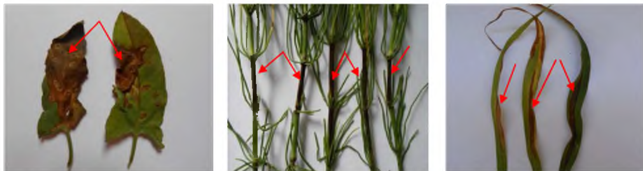
Рис. 2. Прояв штучного зараження березки польової, хвоща польового, плоскухи звичайної виділеними ізолятами бактерій