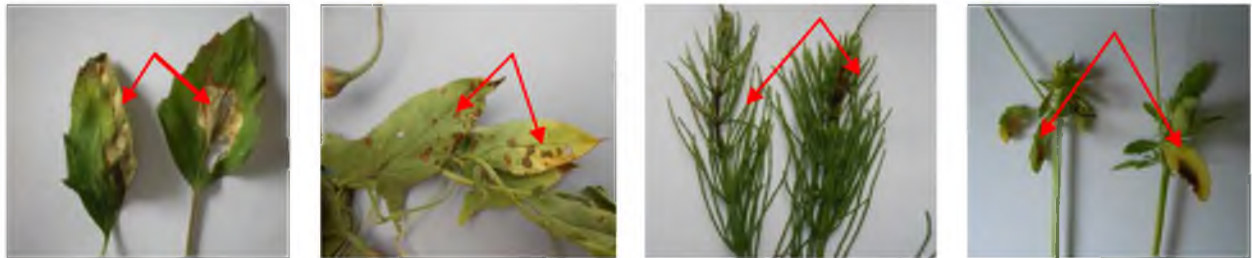
Рис. 1. Природне ураження бур'янів лободи білої, березки польової, хвоща польового, фіалки польової

В результаті бактеріологічного аналізу 340 відібраних зразків бур'янів з ознаками ураження у вигляді чітко окреслених плям коричневого та бурого кольору, деякі з темно-коричневою облямівкою та хлорозом (рис. 1) виділено 509 ізолятів бактерій. 166 із них – патогенні для рослини-хазяїна. Характеристика 90 патогенних ізолятів наведена в таблиці 1.