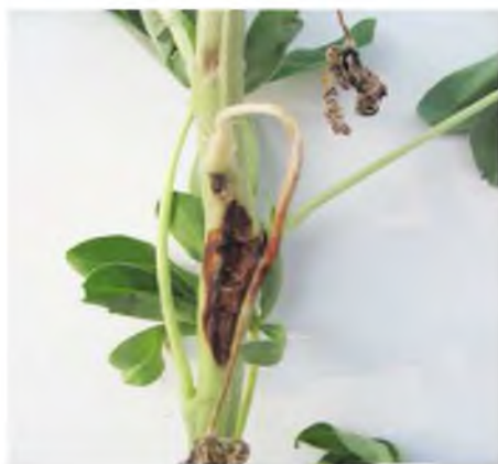
Рис. 2. Візуальні ознаки антракнозу на рослинах люпину білого

Продуктивність люпину білого істотно залежить від стійкості сорту до ураження збудником антракнозу. Тому дослідження стійкості сортів люпину білого до збудників захворювань є актуальною проблемою селекції. Встановлено, що на природному інфекційному фоні ділянок агробіолабораторії педуніверситету сорти Діета та Серпневий протягом періоду дослідження збудником антракнозу не уражалися (рис. 2).