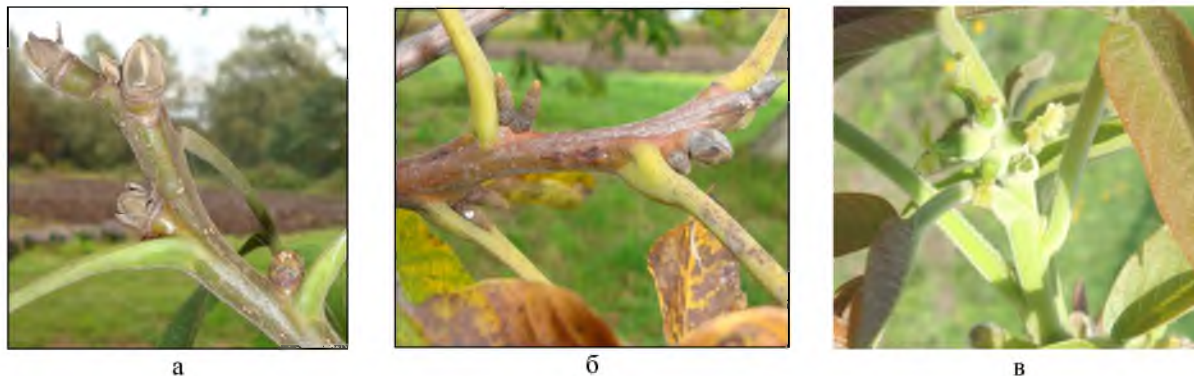
Рис. 1. Типи пагонів J. regia : а - вегетативний; б - вегетативно–генеративний (чоловічий); в - вегетативно–генеративний (жіночий)

Як було відмічено вище, період закладання маточкових квіток тісно пов'язаний із закінченням росту пагонів, тобто закладанням верхівкової бруньки. На початку липня конус наростання верхівкових бруньок сильно витягується і на ньому з'являються опуклості, що мають бічне розташування по відношенню до конуса наростання. Ці меристематичні опуклості являють собою зачаткові покривні листки, в пазухах яких одночасно закладаються квіткові зачатки. Процес зростання покривного листка з квіткою тут зайшов ще далше, ніж це спостерігалось у тичинковій сережці і на ранніх етапах їх розвитку спостерігається куполоподібна меристематична структура, клітини якої інтенсивно діляться (середньодобова температура +20,3^{\circ}\text{C}\pm 0,4 ; вологість повітря — 77,12\% \pm 2,0 ).