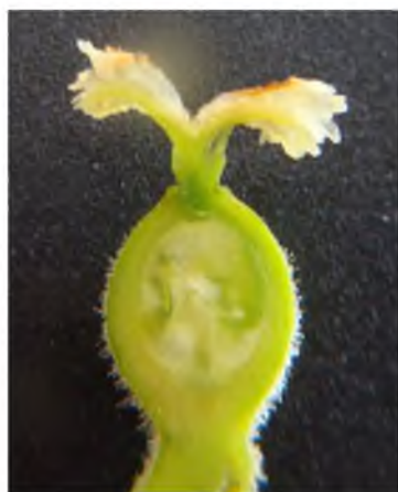
Рис. 3. Жіноча квітка J. regia

Жіноча квітка J. regia має одногнізду густо опушену, клейку нижню зав'язь, утворену двома плодолистками і один насінний зачаток (рис. 3). Оцвітина складається з чотирьох листочків. Насінний зачаток прямий, красинуцелятний, однопокривний. Зовні в основі інтегументу розміщені крилоподібні утвори.