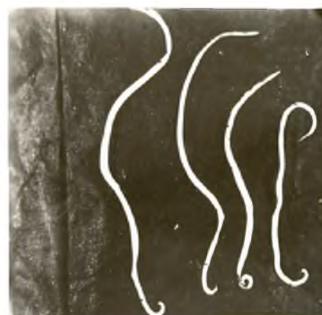
Рис. 4. Кореляція розмірів тіла самців аскариди людської від частоти інвазії (збільшення 8×4)

Нами були зроблені спроби виявити відмінності розмірів тіла паразита відповідно до віку хазяїна (табл. 2).