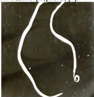
Рис. 1. Статевий диморфізм аскариди людської (збільшення 7×8)

Морфологічні особливості. Дорослі аскариди мають веретеноподібну форму тіла. Живі, чи відразу після виходу з кишечника, аскариди червонувато-жовтого кольору, після загибелі вони стають брудно білими. Самець аскариди помітно менший від самки, довжина його 15-25 см і задній кінець тіла гачкоподібно загнутий (рис. 1). Самка аскариди має рівне тіло завдовжки 25-40 см і 3-6 мм в діаметрі (рис. 2) [4].