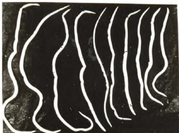
Рис. 3. Кореляція довжини тіла аскариди людської від частоти інвазії (самки, збільшення 8×4)

Візуальне підтвердження зміни розмірів від числа інвазії демонструють фотографії 3 та 4, де помітне зменшення розмірів аскарид при збільшенні інтенсивності інвазії.