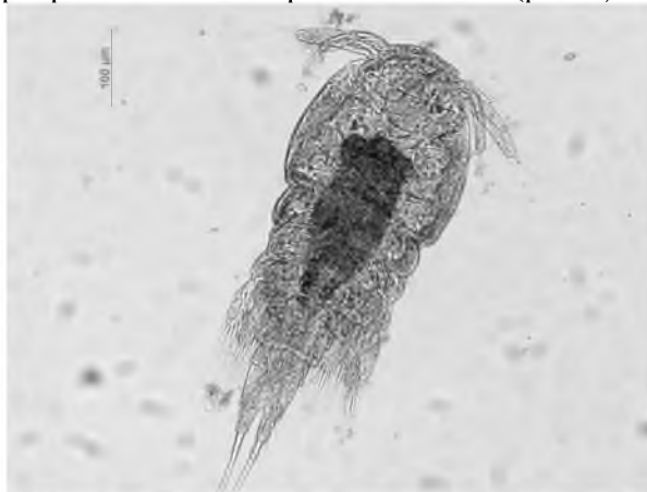
Рис. 1. Циклопідна самка Lernaea sp.

У результаті досліджень було виявлено, що риби практично повністю вільні від інвазії. Лише поодинокі копепоditні стадії паразитичних копепод роду Lernaea були виявлені у зябровій порожнині неприкріпленими до зябрових пелюсток (рис. 1).