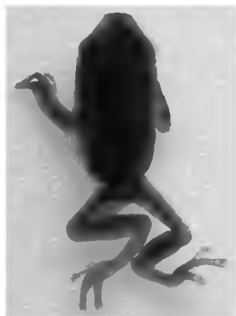
Рис. 3. Сколиотическая особь H. arborea при прохождении метаморфоза

У головастиков квакши, выращенных в 2011 году, сколиоз не был массовым. Среди них обнаружено всего семь сколиотических личинок: с незначительным сколиозом – одна личинка на 38 стадии, со значительным сколиозом – две личинки на 38 и 41 стадиях, с сильным сколиозом – четыре личинки, из которых одна – на 36 стадии, одна – на 39 и две – на 41 стадиях. Это составило 1,8% от общего числа личинок.