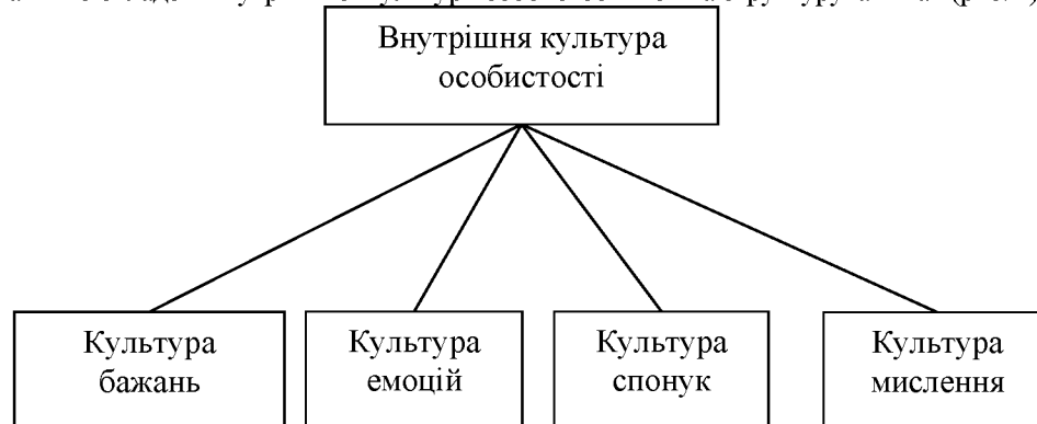
Рис. 1. Складові внутрішньої культури особистості.

Схематично складові внутрішньої культури особистості можна структурувати так (рис. 1).