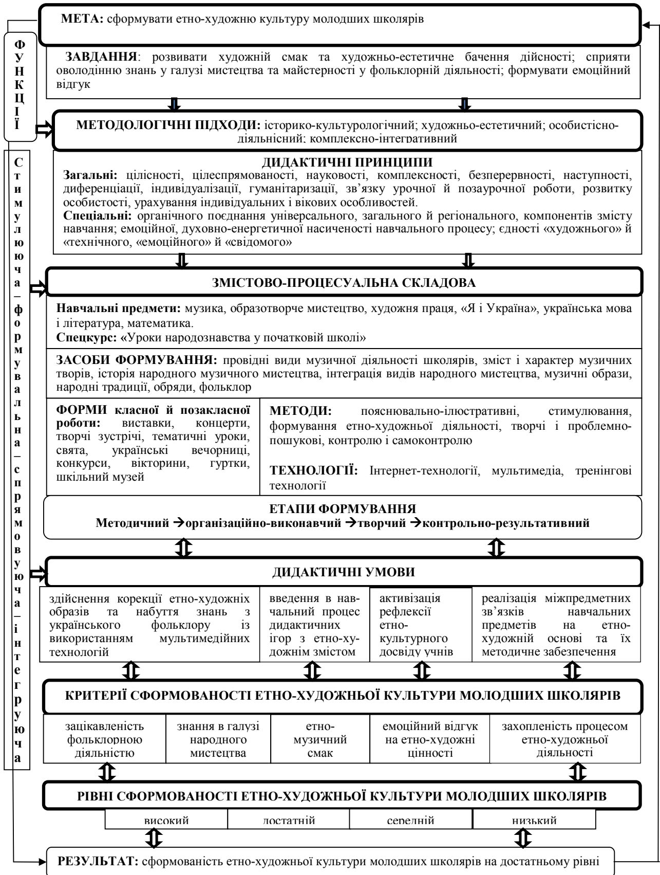
Рис. 1. Функціонально-структурна модель формування етно-художньої культури молодших школярів засобами музики