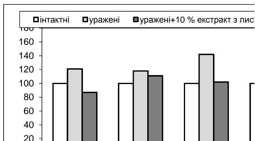
Рис. 1. Вміст ДК у сироватці крові уражених тварин після застосування екстракту з листків калини, %

Примітка. Тут і в наступній таблиці * – вірогідні зміни між інтактними та ураженими тваринами; ** – вірогідні зміни між ураженими та тваринами, які отримували 10 % екстракт із листків калини звичайної ( p < 0,05 ).