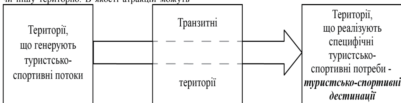
Рис. 4. Структура територіальної системи спортивного туризму з географічних позицій

Виходячи з концептуального розуміння туризму як сукупності відносин і явищ, що виникають під час переміщення та перебування людей за межами постійного місця існування і не пов'язаних з отриманням трудових доходів, ТС СТ з географічних позицій можна представити у вигляді трьох географічних підсистем: території, що генерує туристські потоки, транзитної території і території, що реалізує специфічні туристсько-спортивні потреби – туристської дестинації. Зазначені системні утворення є достатніми для формування елементарної / найпростішої ТС СТ (рис. 4).