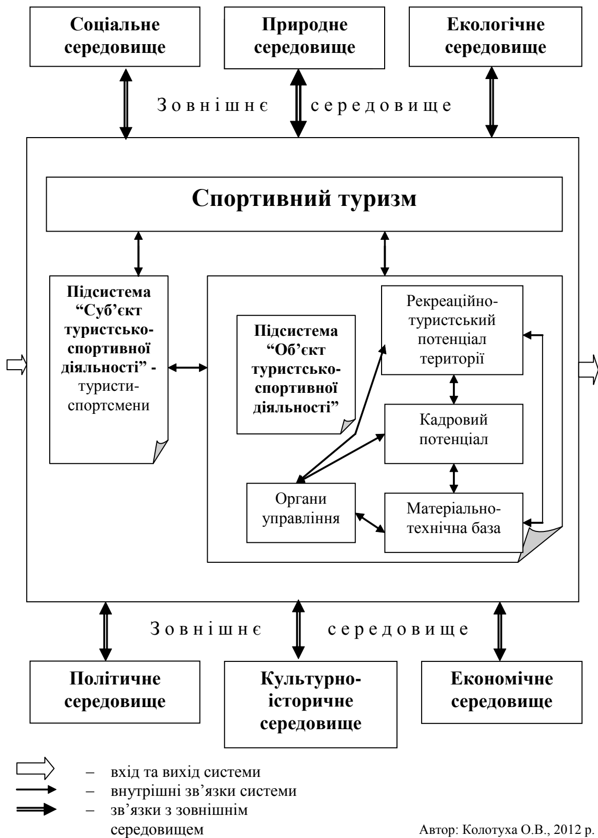
Рис. 2. Спортивний туризм як специфічна територіальна рекреаційна система