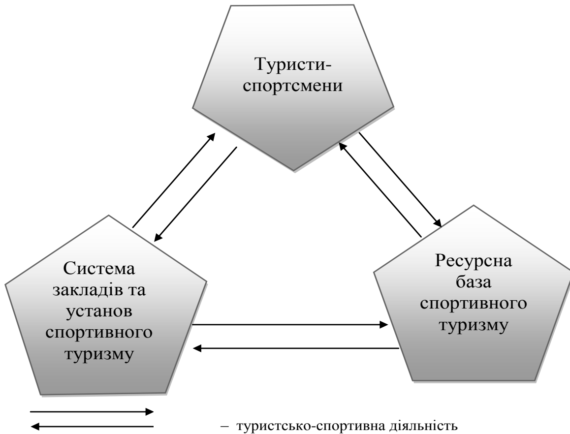
Рис.1. Основні агенти системи "Спортивний туризм"

Ці вимоги обумовлені специфічними рекреаційними потребами спортивних туристів. Потреби формуються під впливом таких факторів, як вік людини, стать, соціальна належність, уподобання, стан здоров'я тощо. Дана підсистема характеризується обсягом і структурою специфічних рекреаційних потреб спортивних туристів, вибірковістю і географією їх туристського попиту, різноманітністю і сезонністю туристсько-спортивних потоків. Спеціалізовані рекреаційні потреби та вибірковість визначають основну функцію ТС СТ.