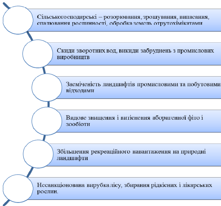
Рис. 2 – Антропогенні чинники впливу на ЛЕМ Черкаського району