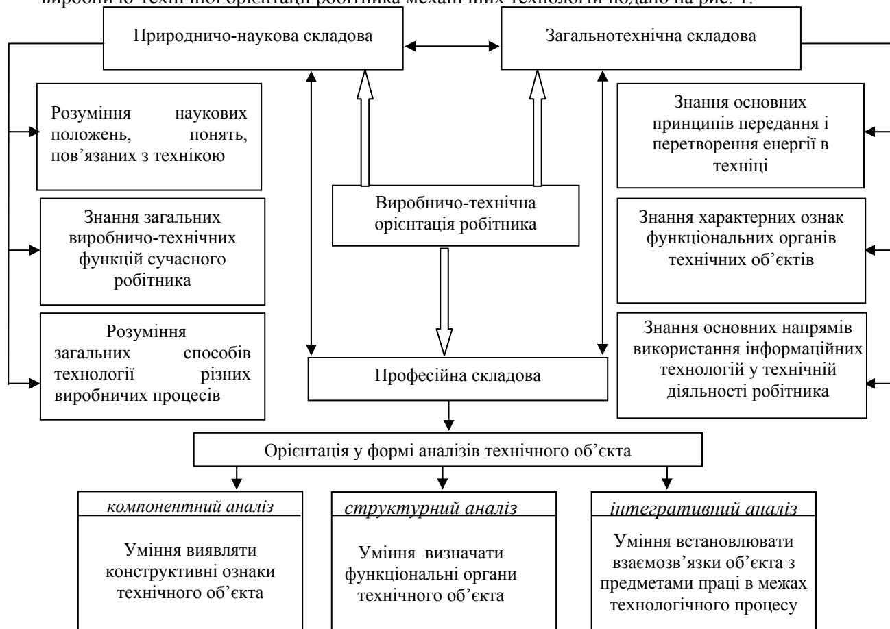
Рис. 1. Модель виробничо-технічної орієнтації робітника механічних технологій.

На основі теоретичного дослідження доробку вчених (П. Атутов, М. Думченко, В. Ледньов) визначено зміст виробничо-технічної орієнтації робітника, який містить взаємопов'язані складові: природничо-наукову, загальнотехнічну, професійну. Модель виробничо-технічної орієнтації робітника механічних технологій подано на рис. 1.