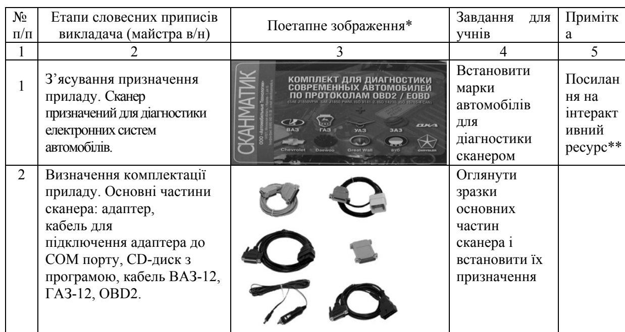
Мультимедійний алгоритм проведення комп'ютерної діагностики автомобіля (на прикладі сканера «СКАНМАТИК»)