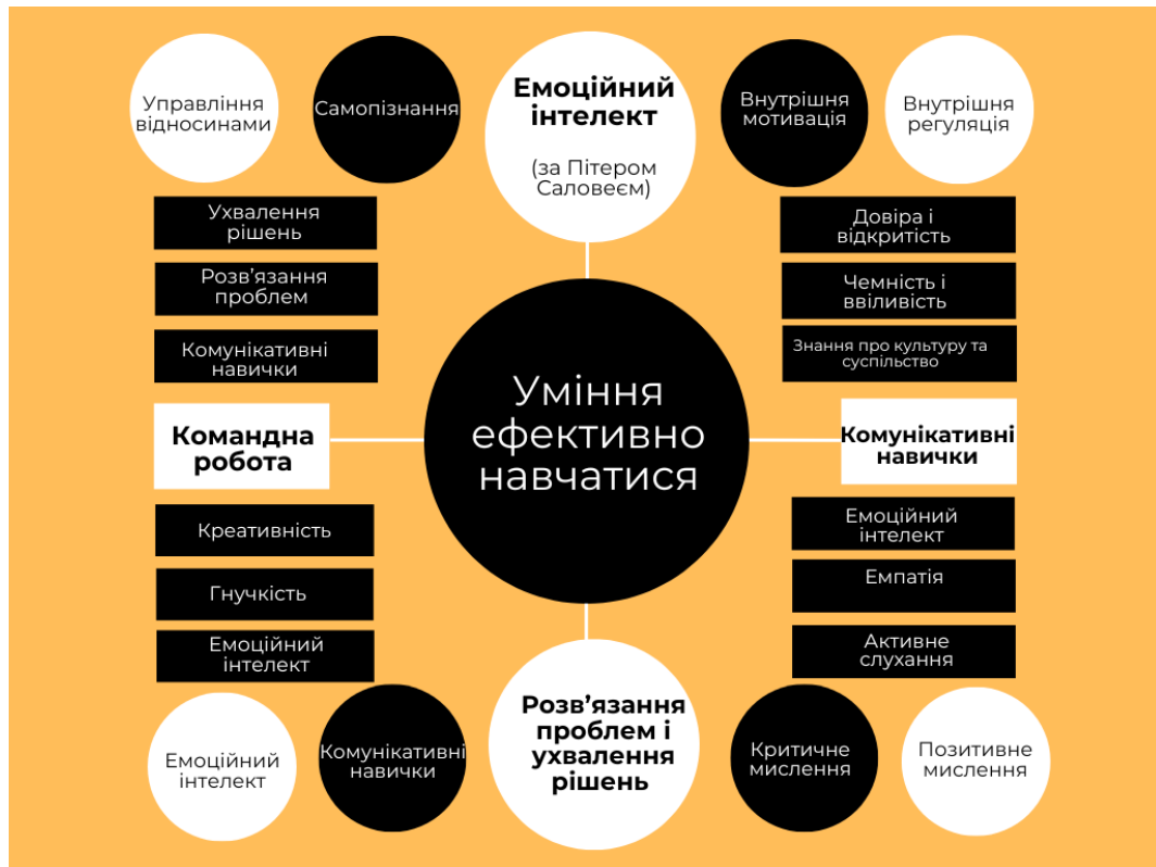
Рисунок 1 – М'які навички для життя