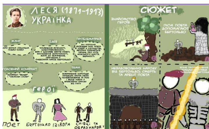
Рисунок 1. Комікс учня до поеми-казки Лесі Українки «Давня казка»

Розвиток жанрово-стильової компетенції в учнів є важливою частиною літературної освіти, оскільки вона допомагає формувати не лише базові знання про художні твори, а й критичне мислення, здатність інтерпретувати тексти на різних рівнях. Так, живопис може виступати важливим елементом аналізу художніх творів, особливо коли йдеться про поетичні або символістичні тексти. Використання картин або ілюстрацій для аналізу таких творів не лише розвиває уяву учнів, але й допомагає їм краще зрозуміти жанрові та стилістичні особливості твору. Наприклад, під час вивчення поеми-казки Лесі Українки «Давня казка», учням можна запропонувати створити власний інтермедіальний продукт – комікс за змістом твору (див. рис. 1).