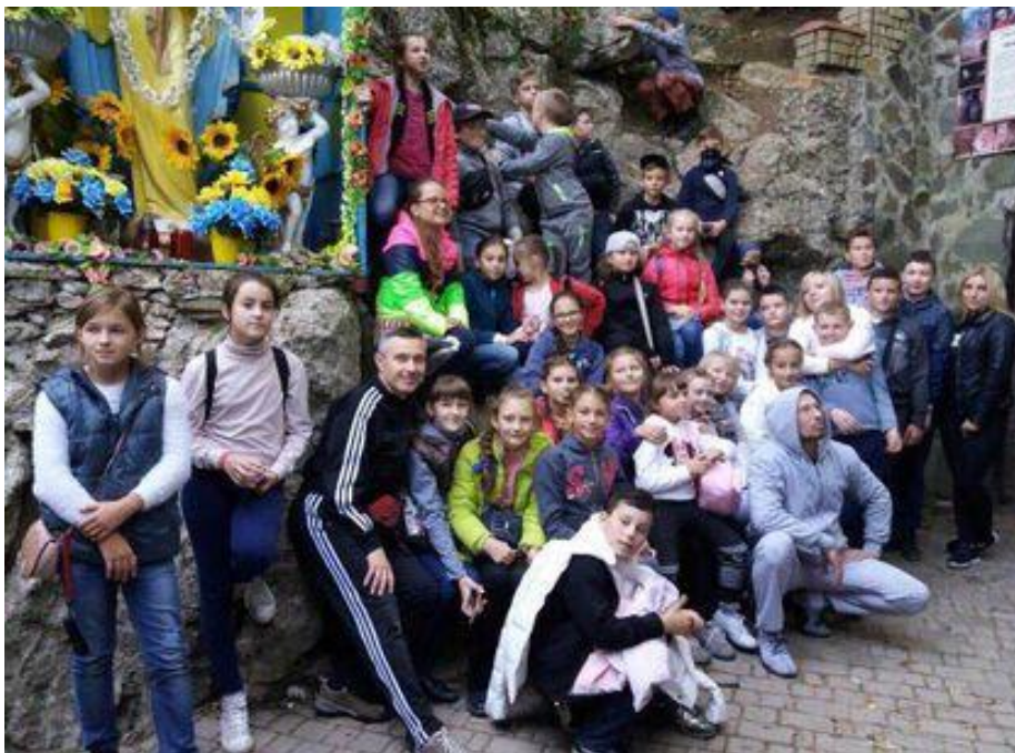
Рис. 2. Печера Кришталева

Кришталева печера стала не лише відомим туристичним об'єктом. Нею зацікавились науковці-медики. Наявні цілющі фактори: постійна температура, вологість і чистота повітря, абсолютна тиша нашоухують на думку про використання печери з лікувальною метою.