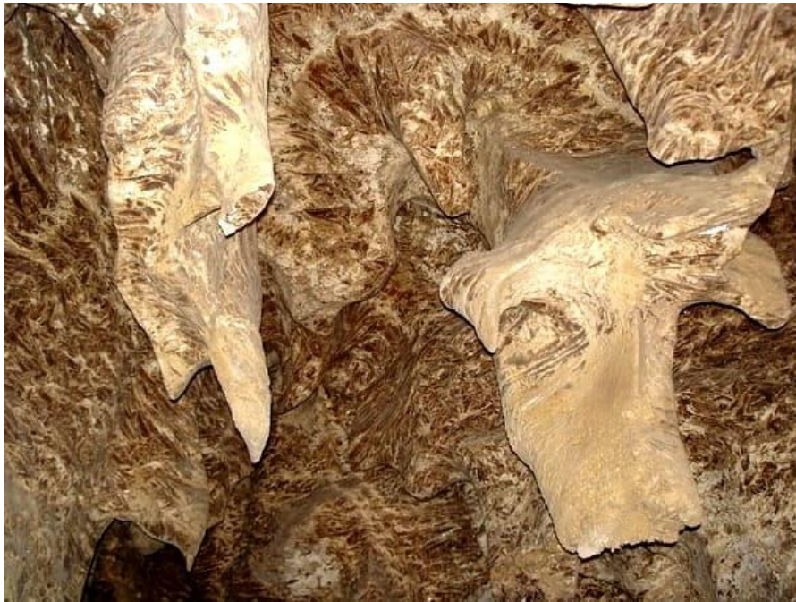
Рис. 1. Кристали гіпсу у подільських печерах

Кришталева печера стала не лише відомим туристичним об'єктом. Нею зацікавились науковці-медики. Наявні цілющі фактори: постійна температура, вологість і чистота повітря, абсолютна тиша нашоухують на думку про використання печери з лікувальною метою.