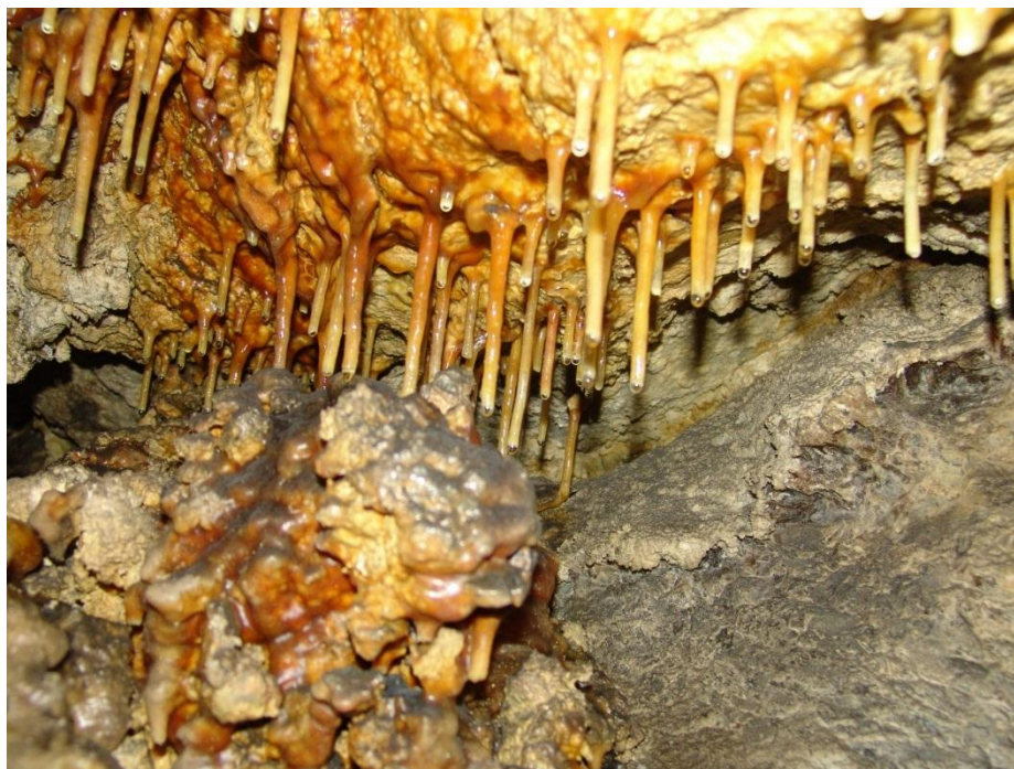
Рис. 4. Трубчасті сталактити у Вертебі

викликаний землетрусом. Мовчазна і холодна Вертеба ховає в своїх тисячолітніх зморшках ще одну загадку.