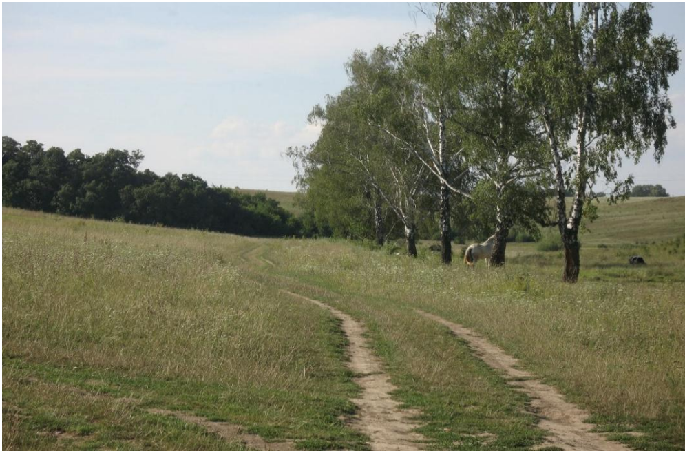
Рис. 4. Дорога від Соснівки (Сцібор) до Сиворіг (Чорного Кута). Зліва – засаджений деревом Юськів рівок, справа від берез – Лиса гора. За нею – поворот направо в Карачинову. На горизонті справа від берез видно верхівки дерев на Соснівці (Сціборах).

Зі Сцібор пошту везли до Сиворіг аж до роздоріжжя, де починалися два спуски: один у Вивуз, другий – до каплички. У 1950-х роках тут ще можна було бачити давню фігуру (кам'яний хрест), яка незаперечно свідчила, що саме на цьому місці колись кінчалось село. Чорного Кута (частина села між Вивузом і згаданих вище урочищ) тоді ще не існувало. Від фігури поштарі спускалися до каплички, далі понад струмком їхали до впадіння його в річку Білу, огинаючи західну збіч.