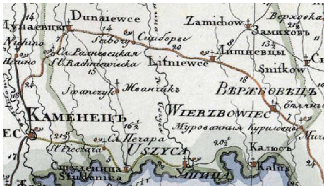
Рис. 3. Поштові станції Ушицького тракту: Літнівці, Сцібори, Дунаївці, Кам'янець-Подільський. Карта початку XIX ст.