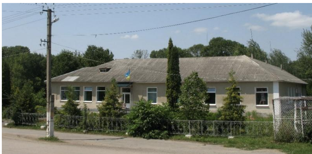
Рис. 1. Великопобіянська середня школа на території колишнього мастку Мархоцьких

Наприкінці 1790 року молода сім'я з двома маленькими дітьми і батьками дружини перебралася з Миньківець до Великої Побійни. Масток Мархоцьких стояв на невеликому підвищенні при в'їзді до Великої Побійни з боку Сиворіг, де тепер знаходиться школа (рис. 1).