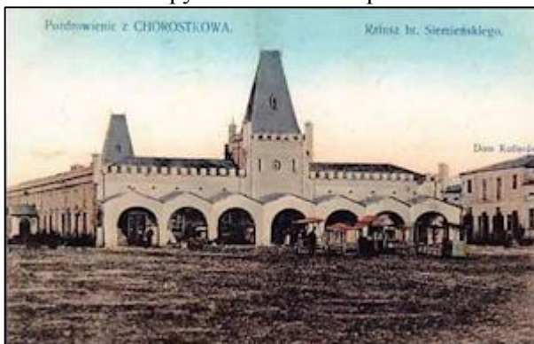
Ратуша у Хоросткові (XVIII ст.). Частково зруйнована 1944 р., розібрана у 1940-х рр.