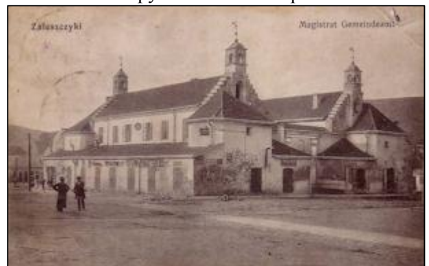
Ратуша у Заліщиках (XVIII ст.). Розібрана у 1969 р.