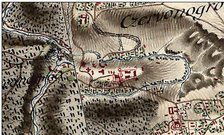
Рис. 3. Червоногород на карті Фрідріха фон Міга [7]

нових територіальних одиниць, швидко розвивалися і перетворювалися у значні регіональні політичні та економічні центри. Ті міста, що такий статус втрачали, поступово деградували, перетворювалися на села або й узагалі зникали з географічної карти. Яскравим прикладом такої деградації є Червоногород (рис. 3) – зникле містечко поблизу с. Нирків (тепер – Чортківський район), що у 1435–1774 рр. було центром однойменного повіту [4]. У 1448 р. тодішнє місто отримало магдебурзьке право, однак після ліквідації адміністративно-територіального устрою, здійсненої австрійським урядом після Першого поділу Речі Посполитої, втратило статус адміністративного центру і поступово занепадало, припинивши своє існування в середині ХХ ст. вже у статусі села Заліщицького району Тернопільської області.