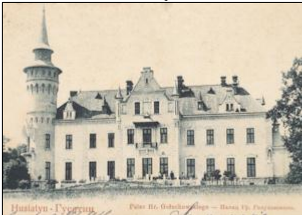
Палац Голуховського в Гусятині (1889). Зруйнований 1914 р.