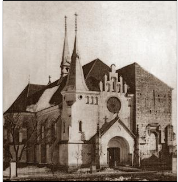
Костел св. Станіслава у Козівій (1899–1902). Зруйнований 1977 р.