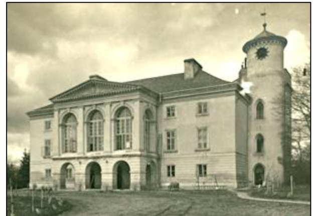
Замок-палац у Гримайлові (XVII ст. – 1840). Зруйнований 1944 р.