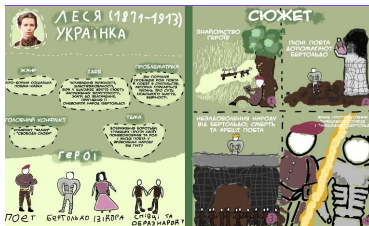
Рисунок 1. Комікс учня до поеми-казки Лесі Українки «Давня казка»

Розвиток жанрово-стильової компетенції в учнів є важливою частиною літературної освіти, оскільки вона допомагає формувати не лише базові знання про художні твори, а й критичне мислення, здатність інтерпретувати тексти на різних рівнях. Так, живопис може виступати важливим елементом аналізу художніх творів, особливо коли йдеться про поетичні або символістичні тексти. Використання картин або ілюстрацій для аналізу таких творів не лише розвиває уяву учнів, але й допомагає їм краще зрозуміти жанрові та стилістичні особливості твору. Наприклад, під час вивчення поеми-казки Лесі Українки «Давня казка», учням можна запропонувати створити власний інтермедіальний продукт – комікс за змістом твору (див. рис. 1).