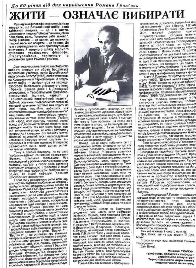
Фото 1. Публікація Миколи Ткачука «Жити – означає вибирати» (газета «Свобода», 1997 р., 18 березня)

журналістикознавчі наративи. На сторінках преси тернопільського регіону віднаходимо чимало таких публікацій. До прикладу, з нагоди вшанування 60-ї річниці від дня народження Романа Гром'яка, на сторінках газети «Свобода» поміщено його допис «Жити – означає вибирати» (1997 р.) [4, с. 6] (Фото 1).