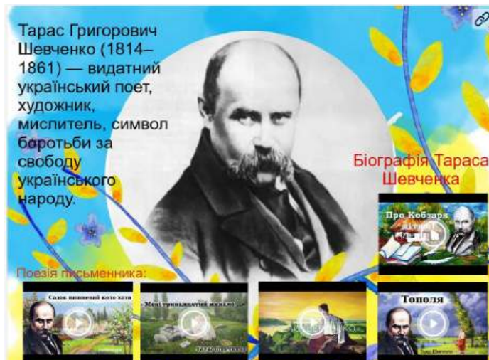
Інтерактивний плакат на тему «Життя і творчість Тараса Шевченка»