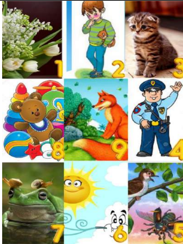
. Кроссенс для учнів 2-го класу (повторення вивчених творів)