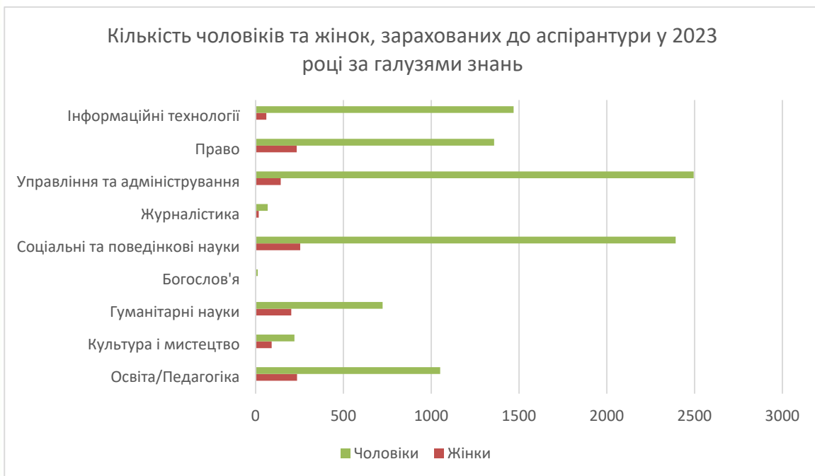
Рис. 3. Кількість чоловіків та жінок, зарахованих до аспірантури у 2023 році за галузями знань

Спробуємо порівняти статеве співвідношення вступників до аспірантури у довоєнний та воєнний час. Кількість аспірантів на 1 січня 2022 року становила 26389 осіб, серед яких жінки становили 12306 осіб, тобто 47%. Таким чином, у довоєнний час зберігалася гендерна паритетність, тоді як у 2023 році зменшилася кількість аспірантів-жінок до 11%. Отже, війна та супутні з нею процеси чинять значний вплив на гендерний паритет у освіті, висвітлюють нові тенденції. Також суттєво відрізняється вибір фаху за галузями знань серед чоловіків і жінок, що є проявом горизонтальної сегрегації. Як видно з рисунку, серед усіх показаних (також не врахованих) галузей знань переважають чоловіки. Значна гендерна диспропорція небезпечна для просування гендерної рівності та підкреслює, що на вибір професії та майбутнього зростання і надалі чинять вплив гендерні стереотипи (див. Рис. 3) [4].