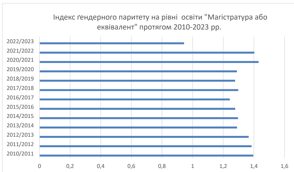
Рис. 1. Індекс гендерного паритету на рівні освіти «Магістратура або еквівалент» упродовж 2010-2023 рр.

Варто звернути увагу на рівні освіти «Бакалаврат або його еквівалент» та «Магістратура або її еквівалент» (на 2022/23 н.р.), де відповідні показники 1,047 та 0,944, тобто майже однакова пропорція статей і спостерігаємо незначне зменшення кількості чоловіків у магістратурі. Якщо порівняти з минулими роками, то у 2020/21 та 2021/22 н.р. жінок у магістратурі навчалося майже на 40% більше (відповідно 1,431 та 1,403). Тенденція щодо співвідношення статей на рівні освіти «Магістратура або її еквівалент» (див. Рис. 1) [4].