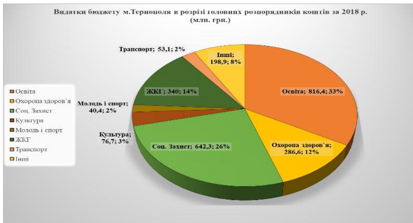
Рис. 1. Видатки бюджету в розрізі головних розпорядників коштів за 2018р. (млн. грн.) [8]

Найбільше коштів спрямовано на сферу освіти та соціального захисту (33% та 26% відповідно). Найменше отримали сфери: культури (3%), транспорту (2%), молоді і спорту (2%).