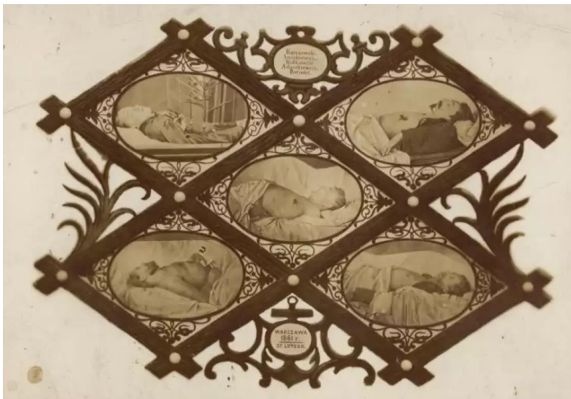
Рис. 1. К. Беєр. П'ять полеглих, 1861

Ще принаймні до середини ХХ століття посмертна фотографія не вважалася чимось дивним, страхітливим або загрозовим. Вона була природною складовою меморіальних практик, поширених у багатьох культурах. «Бачення жанру post mortem як жахливого та навіть дикого — переважно ознака сьогодення» (Філіпова, 2021). Промовистим прикладом, який пов'язує такі фото з етичними номінаціями чутливого візуального контенту в медіях сьогодення, можна назвати світлину 1861 року «П'ятеро полеглих» Кароля Беєра.