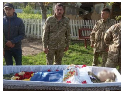
Рис. 4. Вбили за три дні до ротації: на Тростянецьчині прощаються із загиблим у зоні ООС військовим. (2024, 29 липня). Вінниця.info. https://vinnitsa.info/article/zahynuv-zatry-dni-do-rotatsiyi-na-trostryanechchyni-proshchayut-sya-iz-zahyblim-u-zoni-oos-viyskovym-foto

Тому, навіть якщо необхідність висвітлення таких подій не підлягає сумніву, спосіб, у який ці новини подаються, дійсно є дискусійним питанням, і журналісти мають вирішити, чи представляти всю правду, чи поважати жертв. Іншими словами, виклик, із яким стикаються журналісти, полягає в тому, як збалансувати два основні демократичні принципи — людську гідність і право громадськості на інформацію. У цьому контексті необхідно враховувати не лише порушення гідності жертв, але й почуття їхніх близьких. У багатьох випадках родичі померлого несуть його право на конфіденційність і людську гідність, оскільки жертва вже мертва. Вони утворюють вторинне коло осіб, які можуть бути ображені поширенням графічних зображень. Медіа повинні розглянути потенційну цінність показу таких зображень.