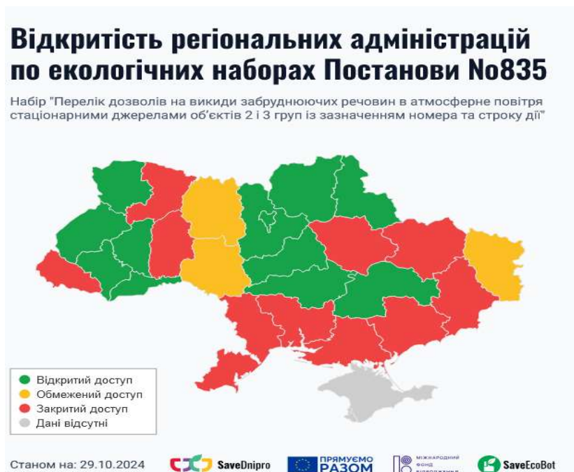
Рис.1. Моніторинг відкритих екологічних наборів даних

моніторингових досліджень, за кількістю обов'язкових до публікації екологічних наборів даних у рейтингу перших є Державна служба геології та надр України, Держпродспоживслужба, Міністерство захисту довкілля та природних ресурсів України, Державне агентство водних ресурсів України, Державне агентство меліорації та рибного господарства України. Основними користувачами відкритих даних є розробники програмного забезпечення, аналітики, дослідники, журналісти й активісти. На основі відкритих даних вони можуть створювати вебсервіси, застосунки, чат-боти, візуалізації даних, інтерактивні карти, а також проводити наукові дослідження та журналістські розслідування [6]. В контексті розгляду екологічних наборів даних Львівщини, варто зазначити, що вони є у відкритому доступі. Львівською обласною державною адміністрацією надається перелік дозволів на викиди забруднюючих речовин в атмосферне повітря стаціонарними джерелами об'єктів 2 і 3 груп із зазначенням номера та строку дії Львівської області (Рис.1.).