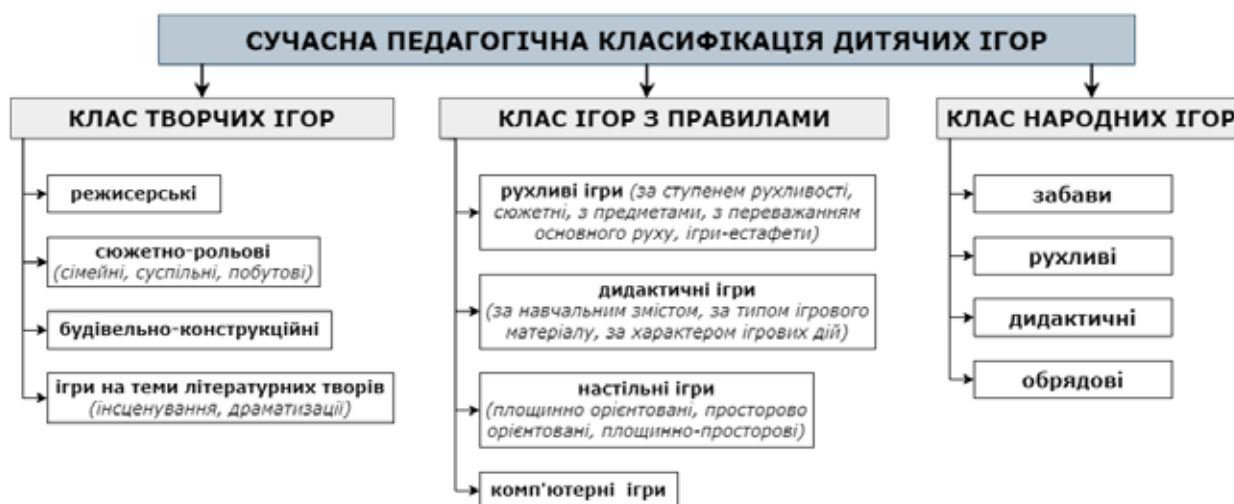
Рис. 1. Сучасна педагогічна класифікація дитячих ігор