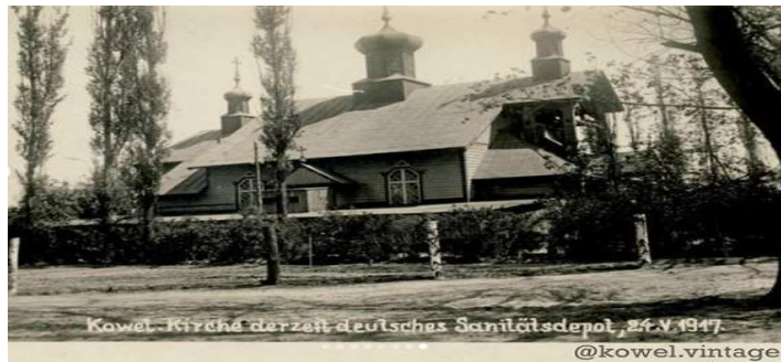
Церква Миколая Чудотворця у Ковелі (24 травня 1917 р.). Напис на фото «Kirche derzeit deutsches sanitätsdepot», що перекладається як «Церква, сьогодні німецьке медичне депо».

Цікавим фактом є те, що О. Брусилов вінчався у Ковелі в церкві Миколая Чудотворця перед початком війни. 10 листопада 1910 р. на вокзалі О. Брусилов зустрів наречену Надію Желіховську, яка приїхала з Одеси до Ковеля. На вінчанні були присутні тільки декілька свідків. Під час австро-угорської окупації з цієї церкви зроблено склад для зберігання медикаментів [4]. Австро-угорська армія: 4-та Армія австро-угорських сухопутних військ (командувач генерал від інфантерії Моріца фон Ауффенберга), що увійшла до складу Східного фронту; польські легіони у складі австро-угорської армії 19 квітня 1915 р. розпочався відступ у ході якого Ковель опинився під окупацією австро-угорського війська, а вже в червні 1916 р. стартувала Луцька наступальна операція. Під час якої, котру ще називають Луцьким (Брусиловським) проривом російські війська прагнули перехопити ініціативу та відкинути лінію фронту в бік австрійської території.