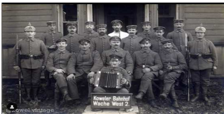
Резервний піхотний батальйон «Saarbrücken» (XXI 14). Ковельська залізниця (середина 1915 р.) Напис на табличці Koweler Bahnhof Wache West 2». Переклад «Охорона станції Ковель, захід 2». Фото з вільних джерел

Попри це, дослідження на місцевому рівні також є надзвичайно актуальними, позаяк допомагає краще зрозуміти цілісну картину Великої війни з її складними причинно-наслідковими зв'язками.