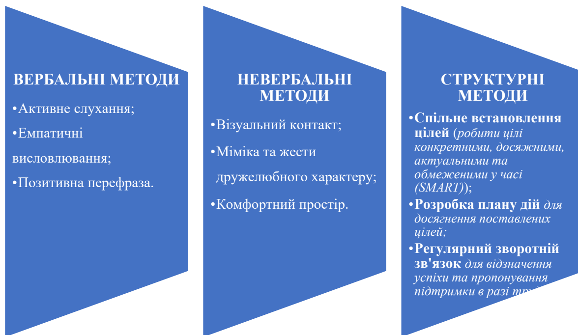
Рис. 3. Прийоми та методи толерантного педагогічного спілкування в процесі мотиваційного консультування.