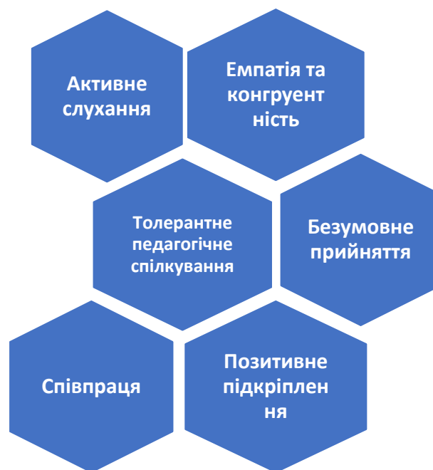
Рис. 2. Елементи толерантного педагогічного спілкування в процесі мотиваційного консультування

Застосування цих прийомів та методів дозволить створити атмосферу довіри та взаєморозуміння, що є ключовими факторами успішного мотиваційного консультування. Толерантне педагогічне спілкування є невід'ємною частиною ефективного мотиваційного консультування, як складна і багатогранна концепція, яка потребує подальшого дослідження та розвитку. Розуміння механізмів толерантності дозволить фахівцям створювати більш ефективні програми мотиваційного консультування в складних умовах суспільних змін.