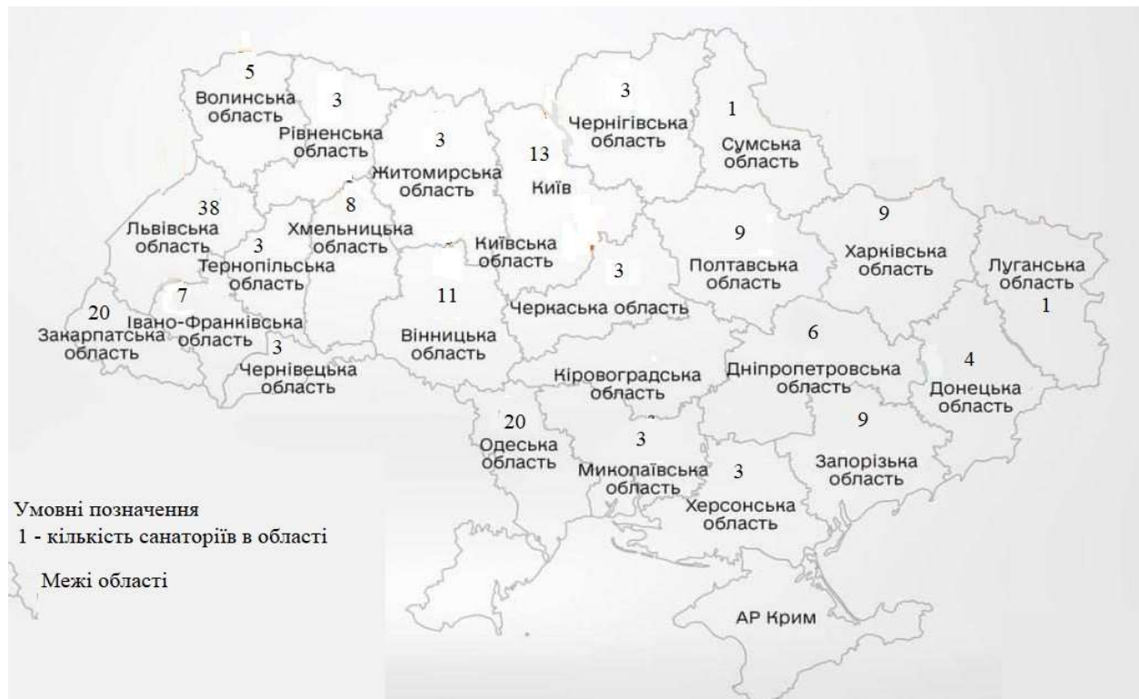
Рис.3 Поширення санаторіїв по території України в 2020 році.

жуть призвести до зменшення попиту на послуги санаторно-курортного відпочинку. Економічна нестабільність та зростання інфляції мають негативний вплив на санаторії, які змушені зменшувати свою діяльність або навіть закритися. На сьогоднішній день основною перешкодою для ведення лікувально-оздоровчого туризму – є безпека перебування туристів на території закладу (рис. 3).