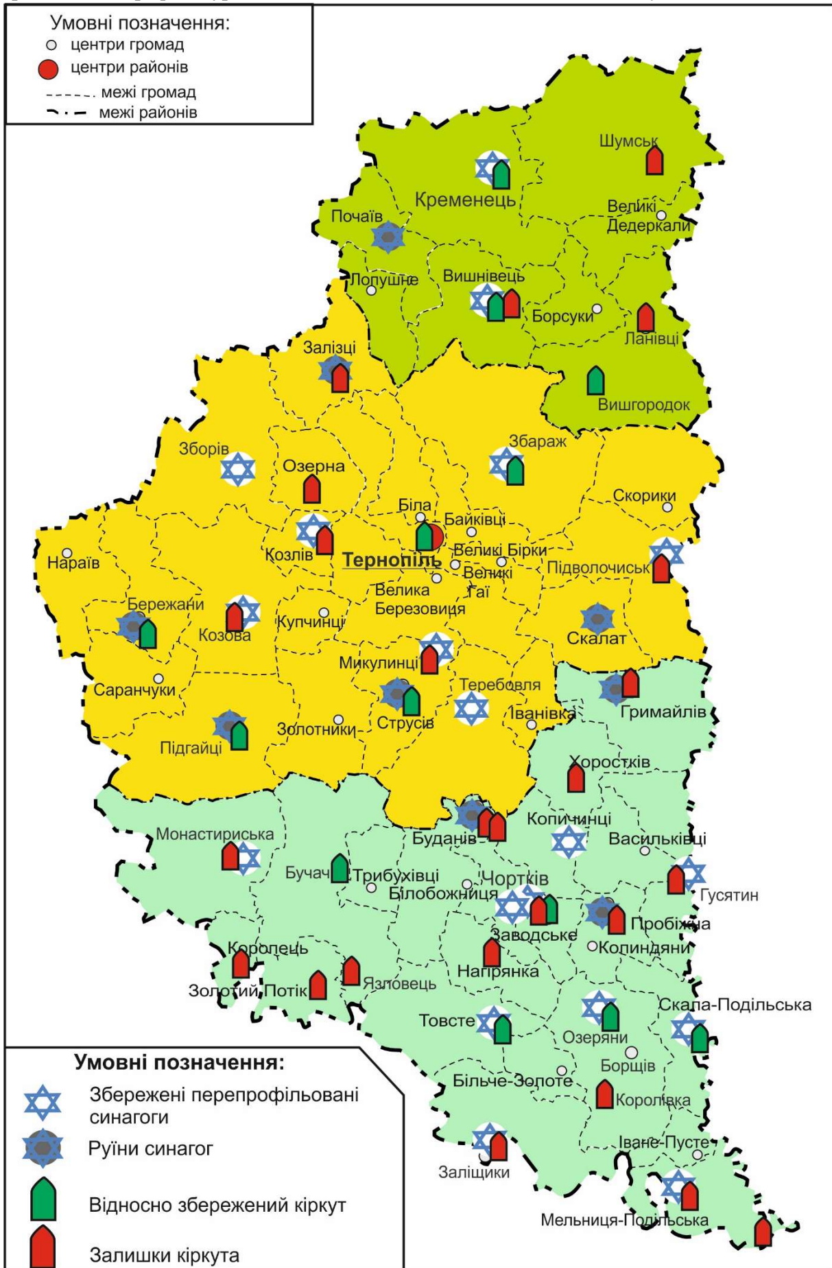
Рис. 2. Поширення і сучасний стан пам'яток єврейської культури в територіальних громадах Тернопільської області (побудовано авторами за даними [1, 9, 10])