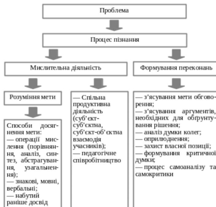
Рис. 4. Процес формування критичного мислення

Очевидно що процес формування критичного мислення найкраще відбувається за наявності певної проблеми, що «запускає» мисленнєвий процес, активізує мисленнєву діяльність у здобувачів освіти та призводить до розуміння мети. Цією метою критичного мислення у здобувачів буде: формування критичної думки, процесу самоаналізу та самокритики (рис. 4) [3].