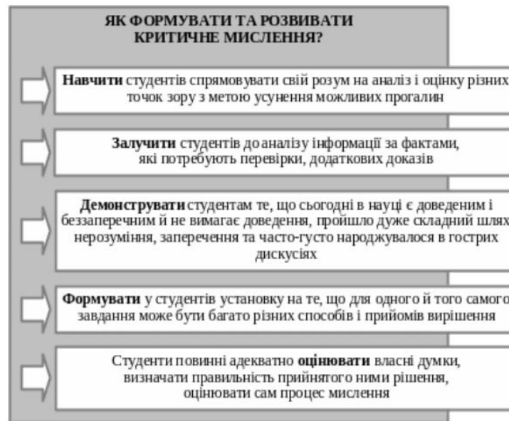
Рис. 3. Формування та розвиток критичного мислення [3]

Очевидно що процес формування критичного мислення найкраще відбувається за наявності певної проблеми, що «запускає» мисленнєвий процес, активізує мисленнєву діяльність у здобувачів освіти та призводить до розуміння мети. Цією метою критичного мислення у здобувачів буде: формування критичної думки, процесу самоаналізу та самокритики (рис. 4) [3].