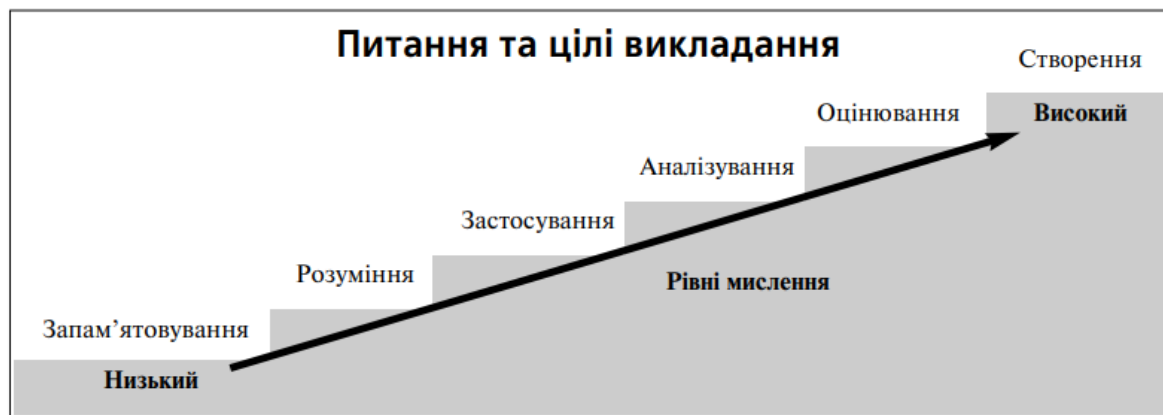
Рис. 2. Питання та цілі викладання [2]

У контексті освіти постає важливе питання про розвиток критичного мислення, яке є одним з актуальних у процесі викладання вже у середній школі, коли починається вивчення предметів з економічного спрямування. Для розвитку критичного мислення від низького до високого у процесі навчання учень чи вже здобувач вищої освіти має пройти шлях від запам'ятовування до розвитку критичного мислення. Ще більш повно це реалізується в університеті, адже після запам'ятовування сприймання і розуміння матеріалу на лекціях слідує його аналіз, узагальнення, систематизація, оцінювання, застосування, аналізування й оцінювання на семінарських заняттях, а також створення нових ідей у процесі виконання курсових робіт. Означені етапи представлені на рис. 2 [2].