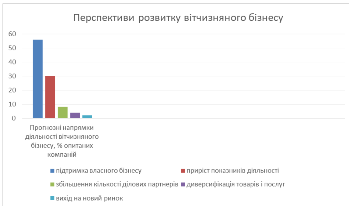
Рис. 1. Перспективи розвитку вітчизняного бізнесу в умовах війни*